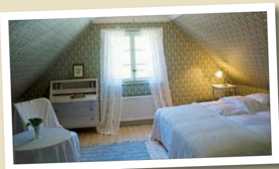
Herrskapsrummet - ett dubbelrum med egen dusch och toalett.