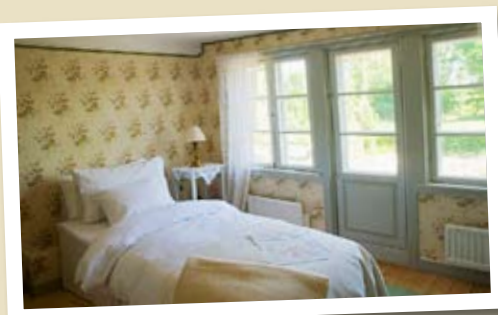
Pigkammaren - ett ljust enkelrum med handfat och utsikt över trädgården.